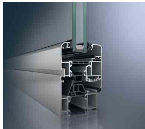
Schüco Fenster AWS 65 SL Schüco Window AWS 65 SL