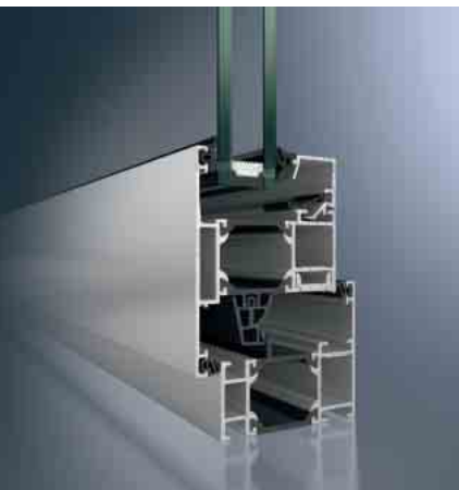
Schüco Fenster AWS 65 Schüco Window AWS 65

Aluminium Fenster-System Aluminium Window System