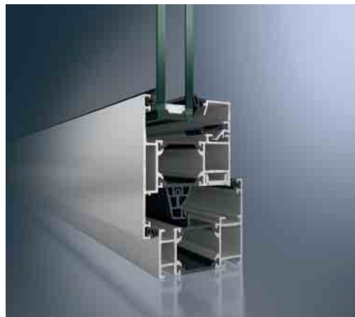
Schüco Fenster AWS 65, außen öffnend Schüco Window AWS 70.H outward-opening